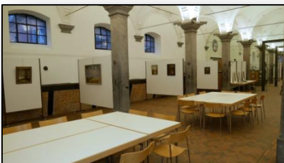
Westsaal (links) mit Stellwände